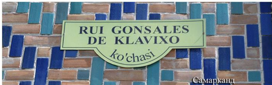
Улица Руи Гонсалеса де Клавихо, Самарканд, Узбекистан

Был такой испанский посол — Руи Гонсалес де Клавихо, который в 1404 году прибыл в Самарканд, где прожил несколько лет, написав очень много интересного о дворе Тимура и о Самарканде в целом. Дневник де Клавихо — это, пожалуй, одна из самых серьезных книг о дворе Тимура и о его политике, архитектуре, садах — обо всем. В Самарканде и в Мадриде есть улицы, названные именем Руи Гонсалеса де Клавихо.