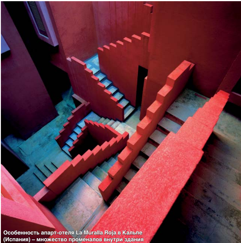
Особенность апарт-отеля La Muralla Roja в Кальпе (Испания) – множество променалов внутри здания