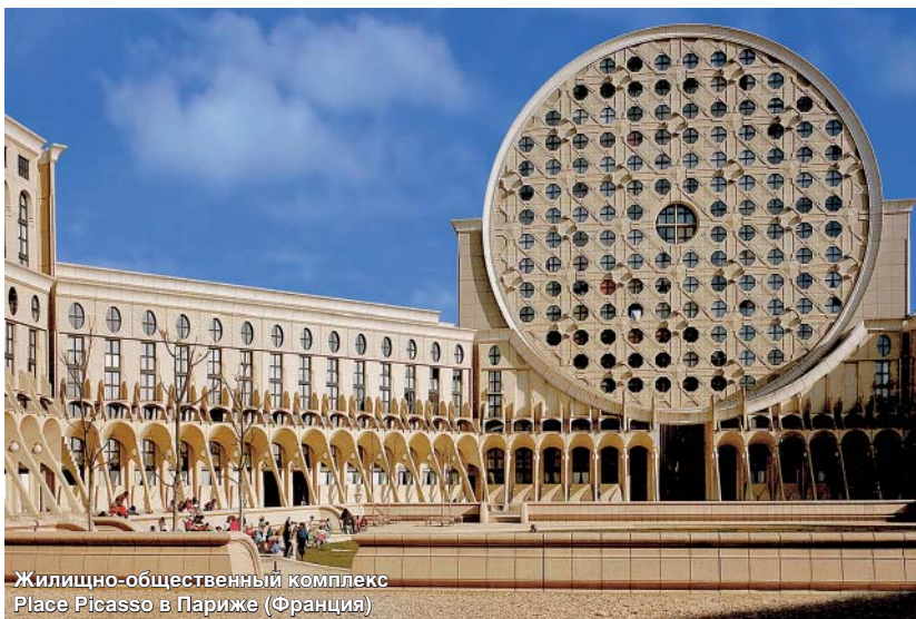
Жилищно-общественный комплекс Place Picasso в Париже (Франция)