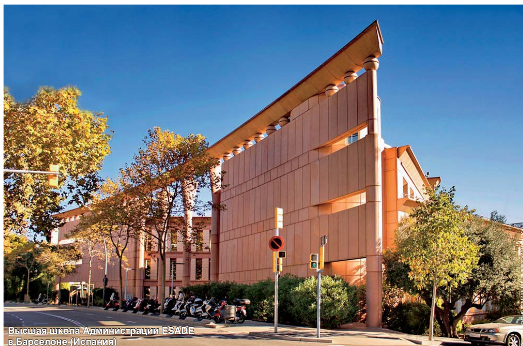
Высшая школа Администрации ESADE в Барселоне (Испания)

За 58 лет я разработал примерно 1500 ландшафтных, градостроительных, архитектурных и дизайнерских эскизов и проектов. Наиболее ценным для меня является мой первый проект по планированию территорий, который я разработал в конце 1980 годов. Это был микрорайон в Севастополе, выполненный во французском стиле.