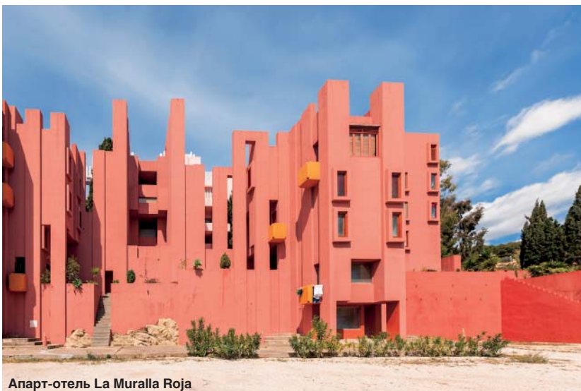
Апарт-отель La Muralla Roja

Тенденций в архитектуре столько же, сколько архитекторов. Если говорить о стиле, то сегодня почти все – от первого до предпоследнего – играют на хайтековский лад с примесью экологичности в союзе устойчивого развития. К сожалению, все вместе взятое ни к чему хорошему не ведет и не решает проблемы качества жизни людей, устойчивого развития, мировой политики и глобальной экономики. Как бы странно это ни звучало, за исключением нескольких