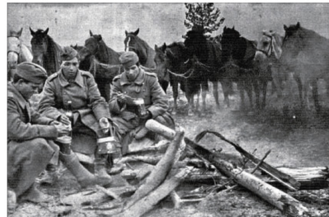
Varios soldados junto al fuego, en un descanso, en un lugar indeterminado del frente ruso

"Somos casi todos falangistas desilusionados, disconformes de cómo van las cosas en la España reaccionaria y quietista que se nos ha organizado. Inconformistas en suma. Se diría que ese interés revolucionario respecto a España eclipsa casi el objetivo natural de la División: intervenir en la Guerra del Este en nombre de España". Es-