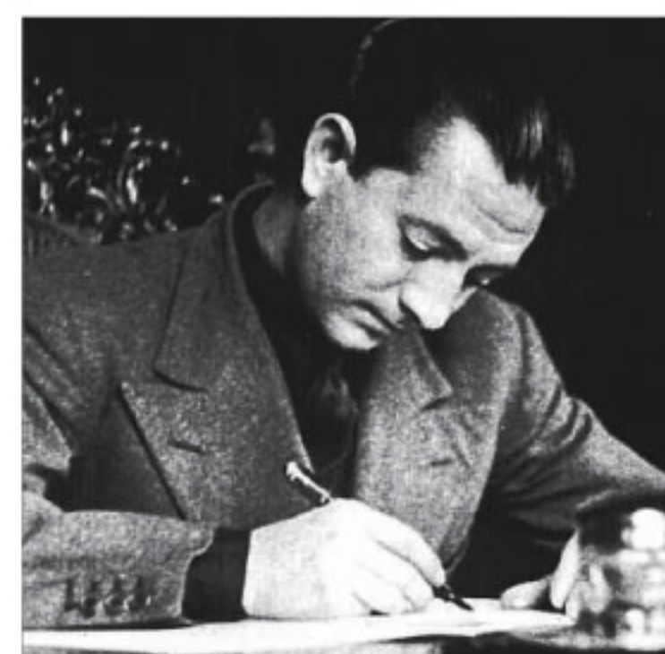
"Cansancio, nieve y nieve", escribió Ridruejo

te pasaje resume el espíritu con el que Ridruejo cruzó media Europa, para adiestrarse primero en Alemania y sumarse después a la ofensiva del ejército nazi hacia un Moscú, adonde tenía miedo de no llegar a tiempo si caían rápido como pensaba. Después, cuando la División Azul