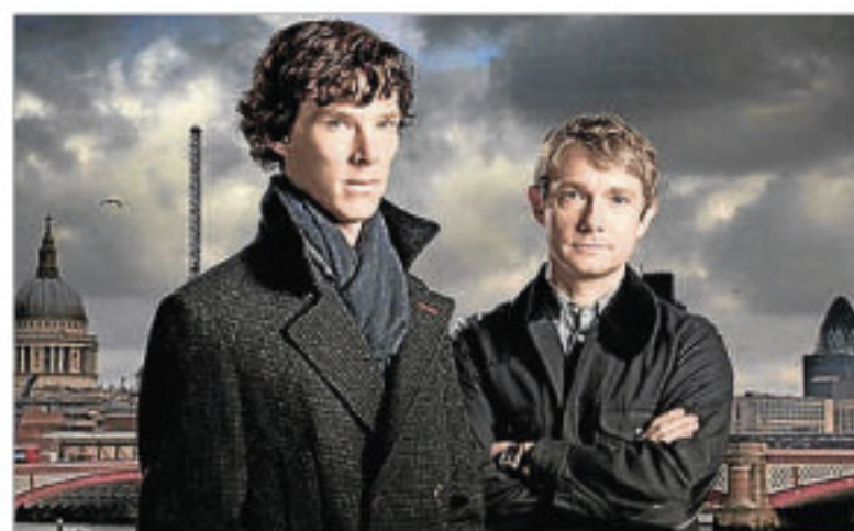
Benedict Cumberbatch interpreta a Holmes y Martin Freeman a Watson en la serie que está emitiendo con éxito la BBC

las causas lógicas, eliminamos las explicaciones no lineales. Cuando una cosa tiene sentido, es difícilísimo verla de otra manera. Las experiencias del neurocientífico Michael Gazzaniga sobre los hemisferios cerebrales muestran que nuestra mente crea narraciones coherentes a partir de elementos dispares, nos incomoda que algo no tenga una causa y el cerebro la establece, por el camino más fácil. Ese es el principal