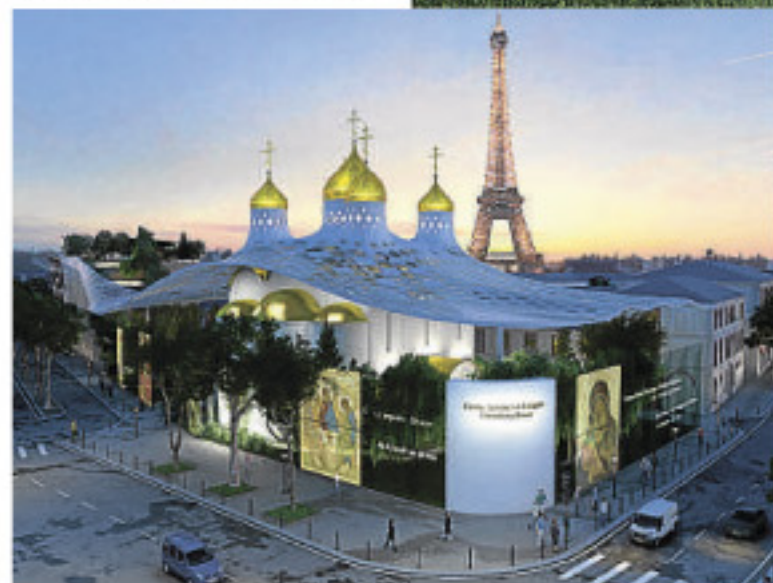
El proyecto del arquitecto español Manuel Núñez-Yanowsky, ganador del concurso de la iglesia rusa, preveía un templo tradicional coronado por cinco bulbos dorados, de los que descendía una gran cubierta de cristal alegórica del manto de la Virgen

El emplazamiento escogido fue una antigua finca propiedad del Estado francés que había albergado la sede de Méteo France -vendida a Rusia por 70 millones de euros- junto al Pont de l'Alma, cerca de la torre Eiffel.