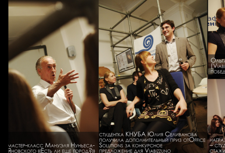
МАСТЕР-КЛАСС Мануэля Нуньес-Яновского («Есть ли еще город?»)

Таким образом, Архитектурный клуб КОНСАУ в который раз выступил площадкой для профессионального общения и творческого совершенствования.